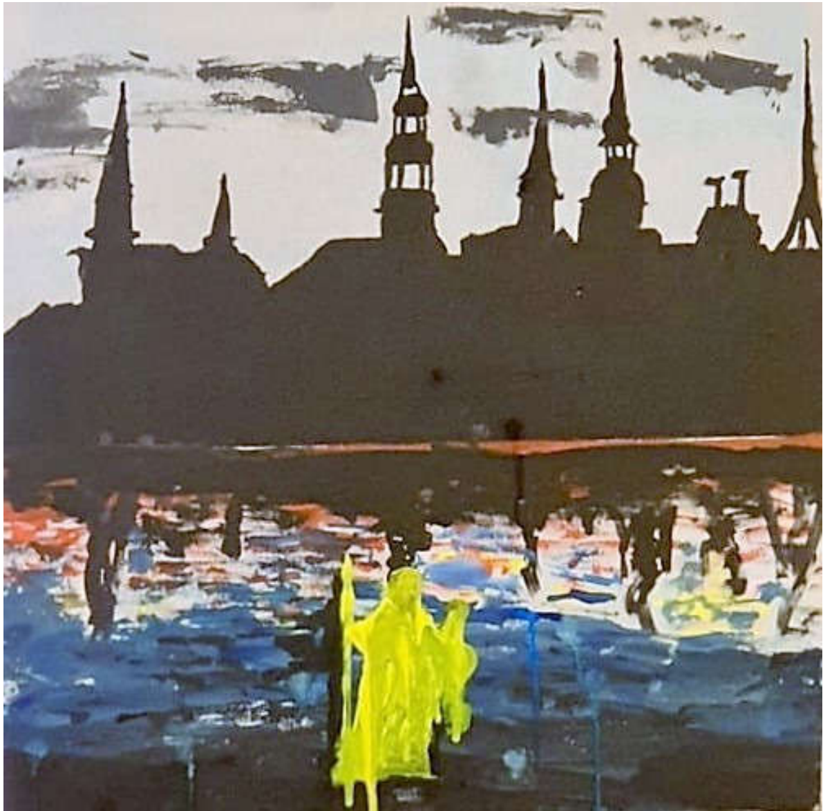
Jakab Béla (humán tagozat): Nagy Kristóf legendája (akril, farost)